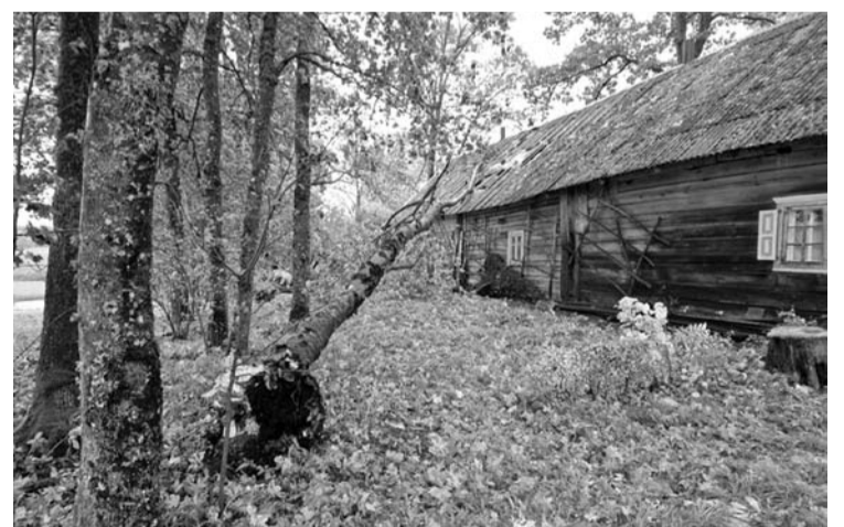
Etnografiniame Maleišių kaime kone kasmet virstantys medžiai apgadina pastatų stogus.