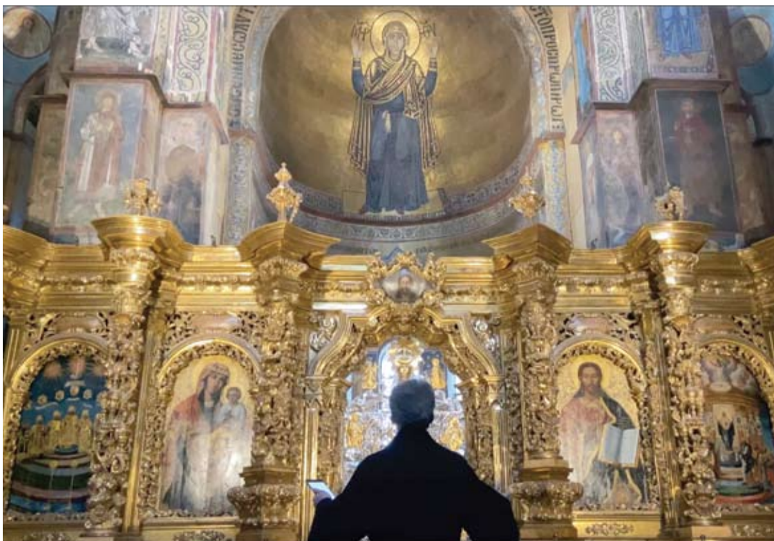
Malda prieš Orantą. Sofijos soboras, 2022 metų kovo 1-oji.