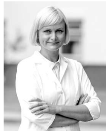
Gydytoja pulmonologė dr. N. Vagulienė sako, kad gydymo nereikėtų pradėti nuo antibiotikų, nes antibiotikai COVID-19 viruso neveikia.

Laboratorių, verifikuotų atlikti COVID-19 tyrimus, sąrašą galima rasti interneto svetainėje www.nvspl.lt/covid-19/laboratorijos-verifikuotos-atlikti-covid-19-tyrimus-pgr-metodu .