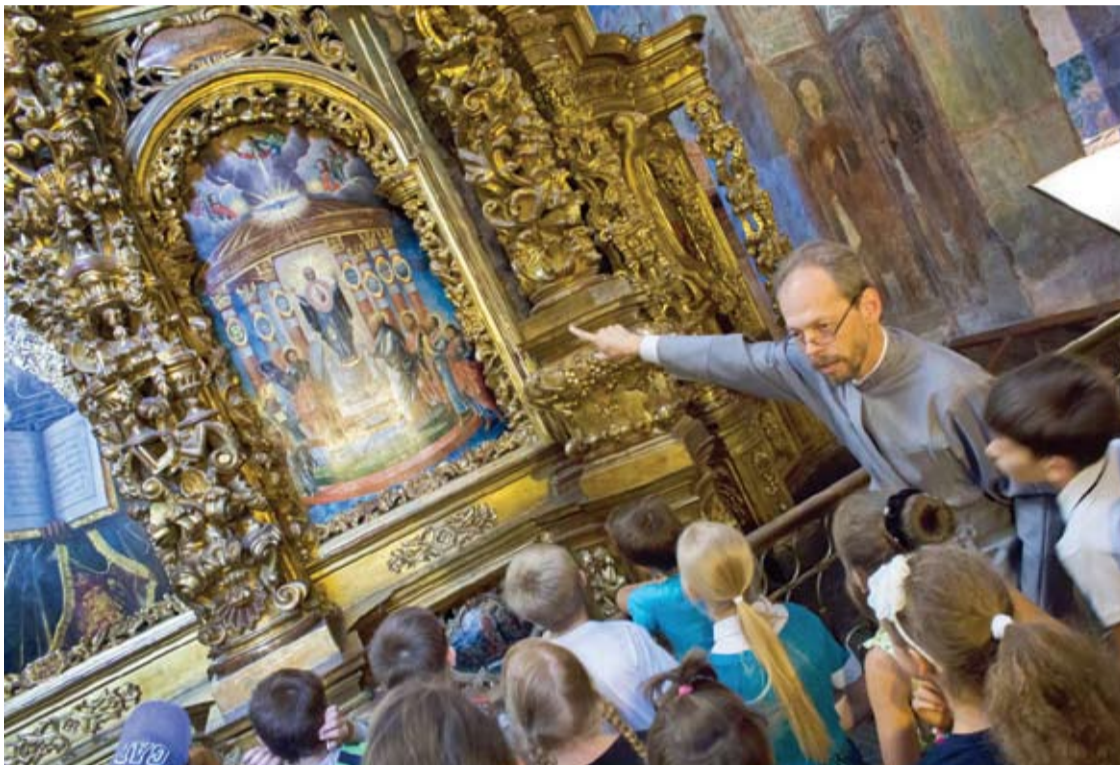
Tėvas Georgijus - Georgijus Kovalenka, Ukrainoje žinomas dvasininkas.

Tėvas Georgijus - Georgijus Kovalenka - svarbiausios Ukrainos šventovės, Kijevo Sofijos soboro, dvasininkas, taip pat vienas žinomiausių ir charizmatiškiausių Kijevo pravoslavų metropolijos šventikų.