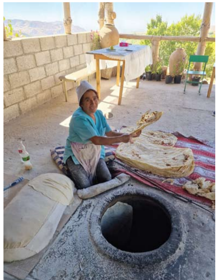
Pakelėse, tarp turistų lankomų objektų, dirba lavašų kepėjos.