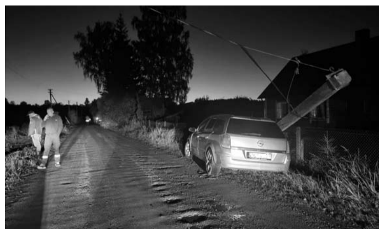
Svėdasų seniūnijos Vikonių kaime neblaivus „opelio“ vairuotojas išvertė stulpą.